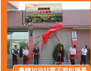
臺糖加油站電子看板揭幕