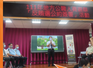
選委會反賄公約簽署活動