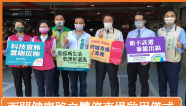
西門健康路立體停車場啟用儀式