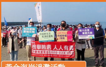
黃金海岸淨灘活動