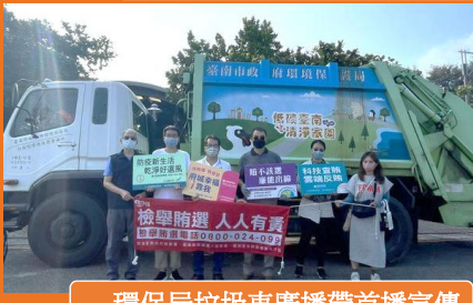
環保局垃圾車廣播帶首播宣傳